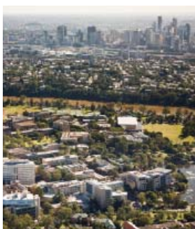
UQ St Lucia

昆士蘭大學(昆大)是澳洲一所居於領導地位的教學和研究型學府，擁有備受讚揚的教師、世界頂級的設施和優美的校園環境，並以此享譽國際。昆大有四大一流校區，學生人數超過45400名，包括來自超過134個國家的11300名國際學生。四大校區分別是位於昆士蘭東南部的St Lucia校區、Herston校區、Ipswich與Gatton校區。位於布里斯班的St Lucia校區是昆大主校區。布里斯班是一座充滿活力的都市，氣候怡人，環境安全，生活素質高。昆士蘭大學課程涵蓋廣泛，多元文化學生帶來生氣勃勃，還有數不清的學生俱樂部和社團，請充分利用昆大的學習經歷吧