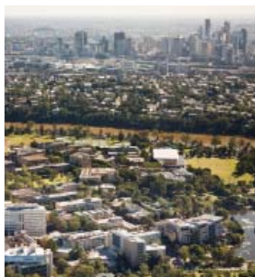
UQ St Lucia

Die University of Queensland gehört zu Australiens führenden Universitäten und ist international für ihre mehrfach ausgezeichneten Forscher und Lehrer, ihre hervorragenden Einrichtungen und ihre besonders schönen und grosszügigen Universitätsgelände bekannt. Mehr als 45.400 Studenten, zu denen über 11.300 Auslandsstudenten aus 134 Ländern zählen, studieren an den vier Standorten im Südosten Queensland, in St. Lucia, Herston, Ipswich und Gatton. Der St. Lucia Campus ist der größte Standort der Universität und liegt in Brisbane, der Hauptstadt Queensland, die für ihr Klima, ihr Umfeld und ihre Lebensqualität bekannt ist. Brisbane ist nicht nur die drittgrößte Stadt Australiens, sondern auch die am schnellsten wachsende Großstadt Australiens.